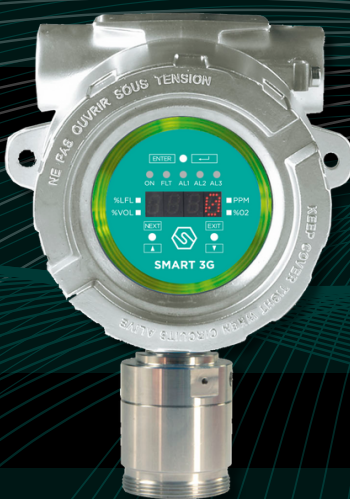
SMART 3G Gr.1