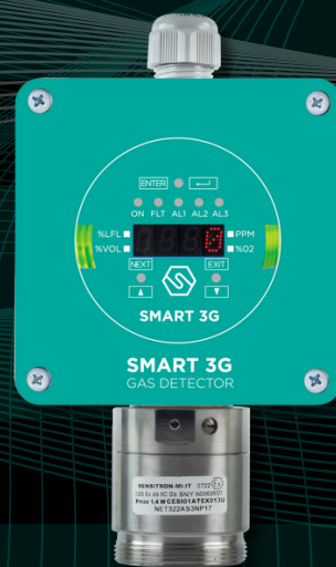
SMART 3G D3