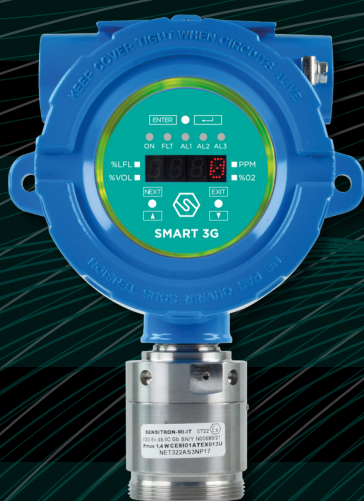
SMART 3G D2