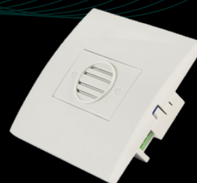
SMART 3H FM LITE