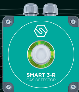
SMART 3 R

Realizzati per essere utilizzati in aree non classificate