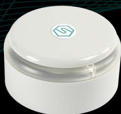
SMART 3H LITE